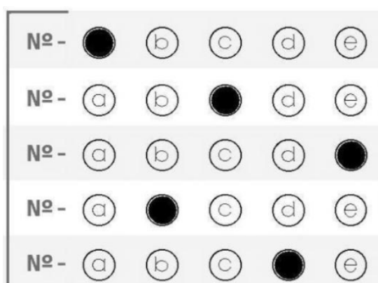
Figura 02 – Preenchimento CORRETO para o Ensino Médio

Formas incorretas de preenchimento do cartão-resposta: